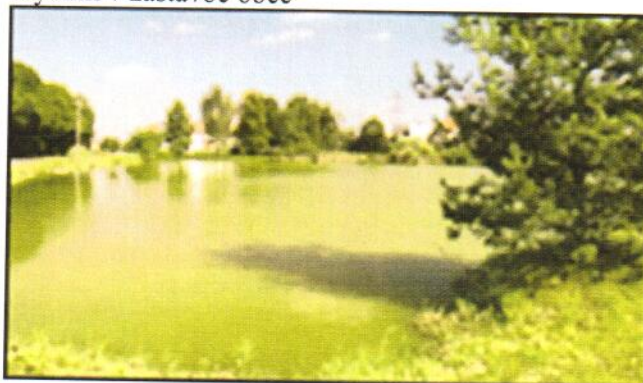
Rybník v zástavbě obce